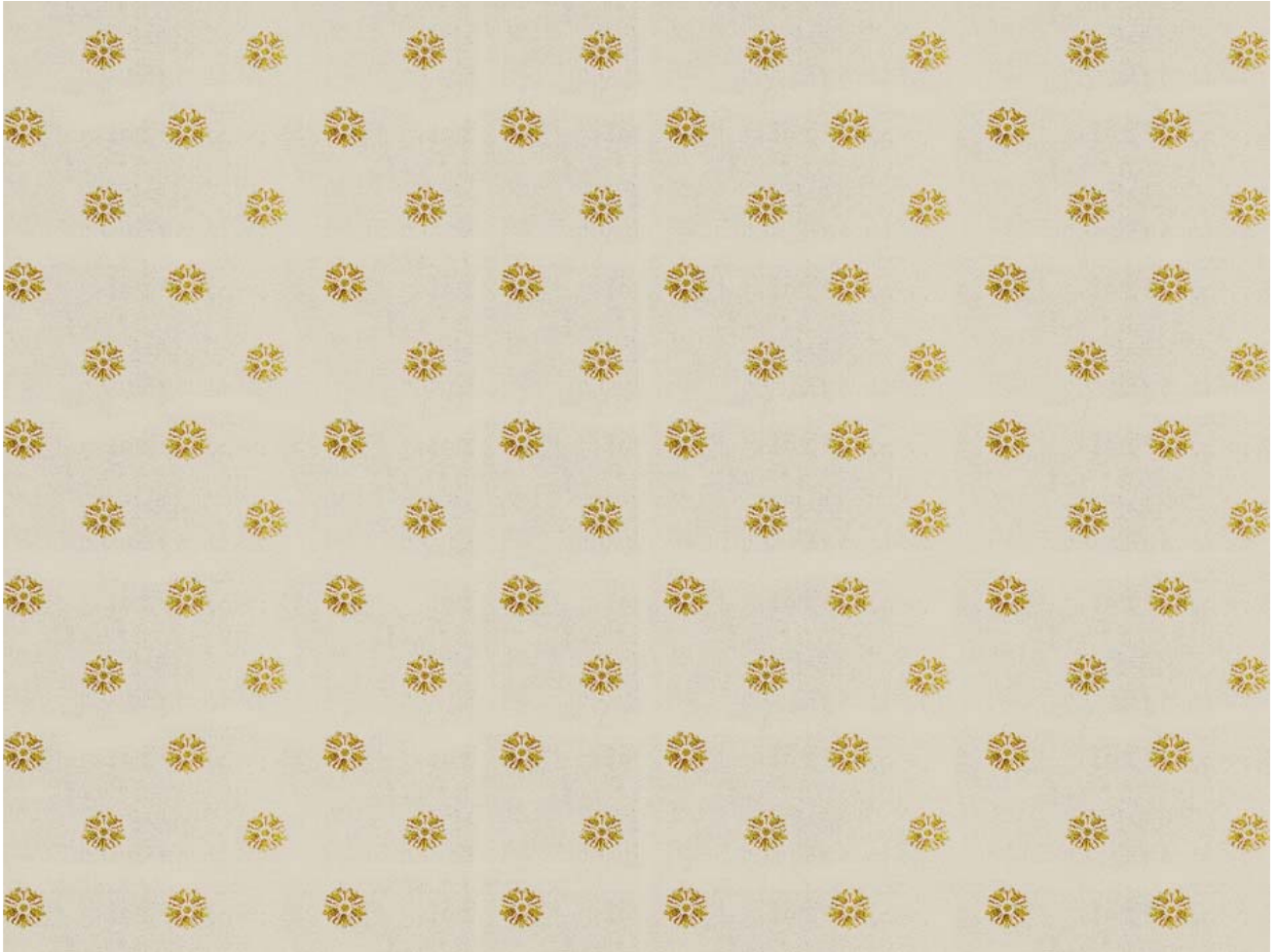
Augereau semé- or - réf : 18680